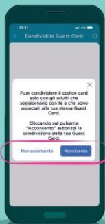
Dai il consenso alla condivisione