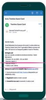
Cerca il codice della tua card nella mail inviata dalla struttura ricettiva