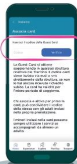
Inserisci il codice della tua card