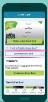
Se associ per primo la card, condividila con gli altri adulti inclusi