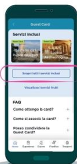
Scopri tutti i servizi inclusi nella tua card