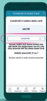
Scegli il canale di condivisione per inviare il codice card