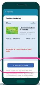
Convalida la corsa a bordo degli autobus o presso le stazioni dei treni.

Scansiona il qrcode o inserisci il codice (TTxxxx)