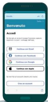
Accedi/Registrati con email o social