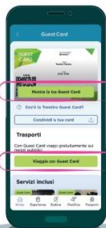
Mostra la card presso musei e attrazioni, viaggia sui mezzi di trasporto